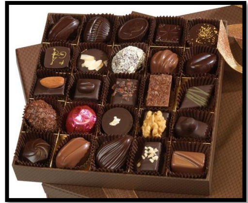
Magasin numéro .....