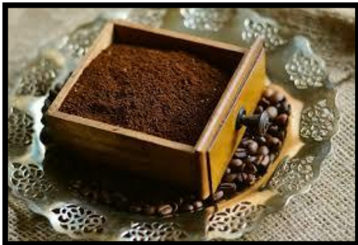
Magasin numéro .....