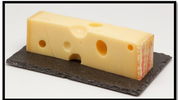
Magasin numéro .....