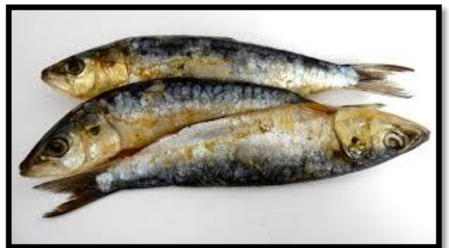
Magasin numéro .....