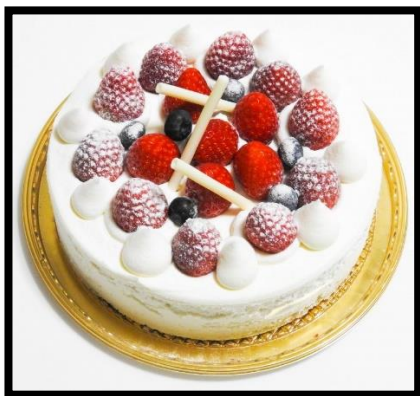
Magasin numéro .....