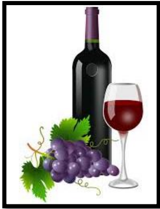
Magasin numéro 1

Écrivez ✍ le numéro du magasin correspondant à l'image.